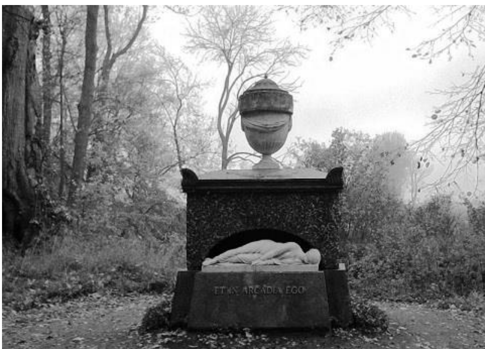
8 pav. Antkapinis paminklas Tuopų saloje atkurtas 2015 m. Stepono Deveikio nuotrauka, 2017. Fig. 8. Monument in the Poplar Island reconstructed in 2015. Photo by Steponas Deveikis, 2017

Arkadijos kultūrinio ansamblio apsauga ir atkūrimas yra tęstinis (ir lėtas) procesas. Pirmiausia suvokta, kad be architektūrinių elementų, ypač be Antkapio saloje Arkadijos idėja tampa nesuprantama. Todėl Muzeum w Nieborowie i Arkadii administracija siekė paminklą atstatyti (Czerwinska, 2015, p. 318). 1972 m. nutarta Antkapį atkurti, o 1982 m. pateiktas pirminis projektas, eskizas pagal Z. Vogelio piešinį (1795). 2001 m. vėl grįžta prie projekto. 2015 m. gegužės 22 d. (Elenos vardadienis) atkurtas paminklas buvo atidengtas (8 pav.).