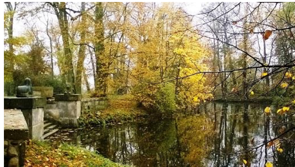
6 pav. Arkadijos parko architektūriniai elementai: kairėje – Akmeninė arka su sargo nameliu; dešinėje – parko tvenkinys. Fig. 6. Architectural elements of Arcadia park: on the left –Greek Arch and Margrave's House; on the right – the pond in Arcadia park.