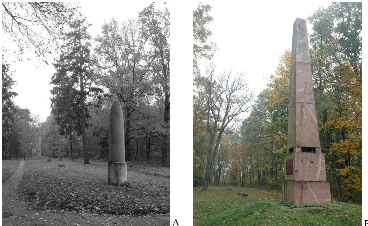
7 pav. Romėniško cirko likučiai: A) bendras vaizdas; B) obeliskas. Bernardo Burbos nuotraukos, 2017. Fig. 7. Remnants of Roman Circus: A) General view; B) Obelisk. Photo by Bernardas Burba, 2017

Arkadijos parko medynuose gausu juodalksnių ( Alnus glutinosa ). Drėgnų ir slėpiningų vietų medis savo tamsia lapija ir tamsiu, išlakiu kamieniu atitinka arkadiškas ir romantines nuotaikas. Juodalksniai Arkadijos parke išties įspūdingi. Ažuolai ( Quercus robur ) – taip pat arkadiškų ir romantiškųjų parkų medžiai, sietini su šventomis senovės giraitėmis, galybės ir ilgos istorijos simbolis – Arkadijos parke yra labai svarbus. J. Balkevičiaus (2010) teigimu, azuolas romantizmo epochoje buvo populiarus parkuose ne tik dėl to, kad jis ilgaamžis, vadinasi žilos senovės liudytojas, bet ir dėl to, kad jis nepakenčia karpymo (kaip liepa ar skroblas), todėl yra individualybė, o ji romantizmo epochoje buvo ypač vertinama.