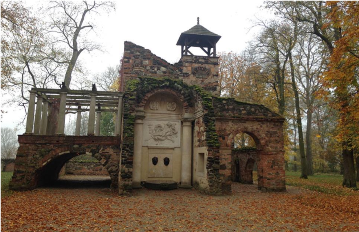
5 pav. Vyriausiojo žynio namelis su bareljefu „Viltis maitina Chimera...“ Bernardo Burbos nuotrauka, 2017 Fig. 5. The High Priest's Sanctuary with a bas-relief of Hope feeling a Chimera... Photo by Bernardas Burba, 2017

saloje rymojo Aukuras, o Tuopų saloje – simbolinis antkapis kunigaikščienei Elenai su daugiareikšmiu įrašu. Romantizmo dvasios ir elementų parke išliko iki šių dienų (6 pav.).