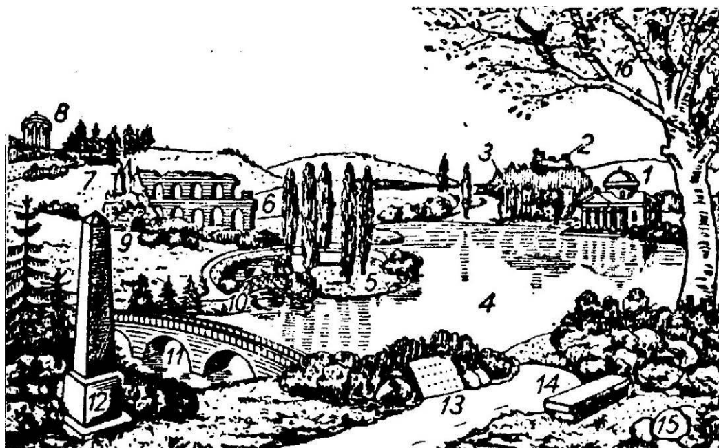
1 pav. Romantiškojo parko elementai (pagal G. Cioleką, 1978): 1) rūmai; 2) griuvėsiai; 3) žydintis darželis (klomba); 4) ežeras; 5) elegiškoji Tuopų sala; 6) akvedukas; 7) kalnai (uolos); 8) pavėsinė ( glorietė ); 9) grotas; 10) kiniškas tiltelis; 11) romėniškas tiltelis; 12) obeliskas; 13) atminimo akmuo; 14) suolelis; 15) riedulys; 16) medis vienišius (soliteras).

Radvilų giminės tėvonija Lenkijoje – Nieborovas ir Arkadija ( Nieborów i Arkadia ). Galinga ir įtakinga kunigaikščių Radvilų giminė Abiejų Tautų Respublikoje tėvonijas kūrė ne tik LDK žemėse – Nesvyžiuje, Olykoje, Vilniuje, bet ir Lenkijos karūnos žemėje – Varšuvoje ir Nieborove prie Lovičių ( Nieborów kolo Lowicz ). Nieborovo dvaro sodyba su didžiuliu barokiniu parku iki pat Antrojo pasaulinio karo išliko Radvilų tėvonija ir šeimos dvaru. Nuo 1945 m. čia įsteigtas Varšuvos nacionalinio muziejaus filialas. Išsaugoti rūmai ir parkas. Tačiau šįkart žvelgiame į Arkadiją, kurios istorija prasideda 1778 m., kai Elena iš Pšezdzečių Radvilienė ( Helena z Przewdzieckich Radziwillowa , 1753–1821), Vilniaus vaivados ir Nieborovo dvaro valdytojo Mykolo Jeronimo Radvilos (1744–1831) žmona, imasi čia kurti angliško stiliaus parką, iš Lovičių kolegijos nupirkusi Lupios kaimą prie Lupios upelio (dabar Skierniewka) (Czerwinska, 2015, p. 308). Iki pat mirties ji kūrė savo Arkadiją – ramybės ir kontempliacijos, filosofinių apmąstymų vietą, romantiškąjį sentimentalųjį parką. Tokia romantiškojo parko idėja, gamtavaizdinio angliškojo parko atmaina, ilgai klestėjo ir išliko Europoje, o ypač ATR (1 pav.).