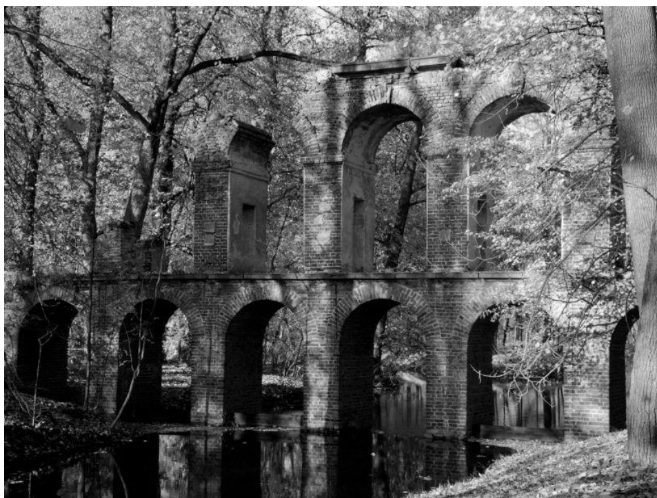
4 pav. Arkadijos parko akvedukas, architektas S. B. Zugas, 1784 m. Stepono Deveikio nuotrauka, 2017. Fig. 4. Arcadia Park Aqueduct, designed by architect S. B. Zug, 1784. Photo by Steponas Deveikis, 2017

Menotyrininkai teigia, kad romantiškojo parko kompozicinių priemonių ir elementų rinkinys mažai kuo skiriasi nuo angliškojo parko. Tik romantiškojo parko kompozicijoje statinių ir dekoratyvinių elementų naudojama daugiau ir daug dažniau nei angliškajame parke. Statiniams būdinga daugybė prasminių ir simbolinių užuominų (Balkevičius, 2010, p. 152–154). Romantiškajam parkui būdinga ir dažnai taikoma nuoseklus prasminio ir simbolinio maršruto (temos) aplink vandens telkinį schema. Šia schema paremta Arkadijos parko kompozicija, daug dėmesio skiriama vandens pakrančių (hidrotechniniams) statiniams, pvz., vienas jų – romėniškasis akvedukas su kaskada (1784, architektas S. B. Zugas; 4 pav.).