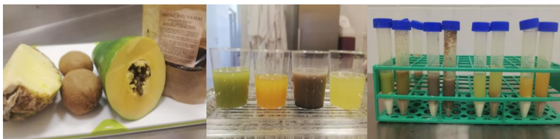
1 pav. Augalinių ekstraktų paruošimas Fig. 1. Preparation of plant extracts

Augaliniai ekstraktai (žr. 1 pav.) buvo paruošti pagal anksčiau pateiktą metodiką. Fermentavimui pasirinkta 37 °C temperatūra, kadangi ši temperatūra yra optimali daugumos fermentų aktyvumui (Li ir kt., 2016; Kaur ir kt., 2010).