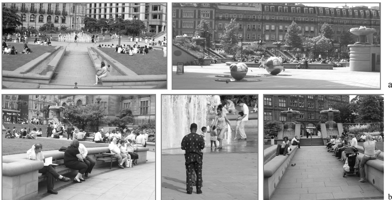
1 pav. Taikos sodai Šefildo miesto centre: a) bendras vaizdas; b) socialinė želdyno funkcija

Taikos sodų projektas, jo įgyvendinimas ir želdyno funkcionavimas puikiai iliustruoja pirmajame skyriuje išskirtus penkis miesto socialinės aplinkos ir želdyno sąveikos aspektus: šis želdynas – tai platesnės miesto fizinio, socialinio ir ekonominio atgaivinimo strategijos dalis (sisteminis, ekonominis aspektai); Taikos sodai tarnauja kaip trumpalaikės miestiečių rekreacijos vieta ir suburia žmones bendrauti (rekreacinis, socialinės sanglaudos skatinimo ir demokratinės visuomenės formavimo aspektai); želdynas, atspindintis postmodernios architektūros tendencijas, įsilieja į aplinką, bet kartu atspindi sukūrimo laikmetį bei suvienija ir įkūnija visuomenės pageidavimus, menininkų, architektų, kitų specialistų kūrybą ir darbą (kultūrinis ir paveldosauginis aspektai).