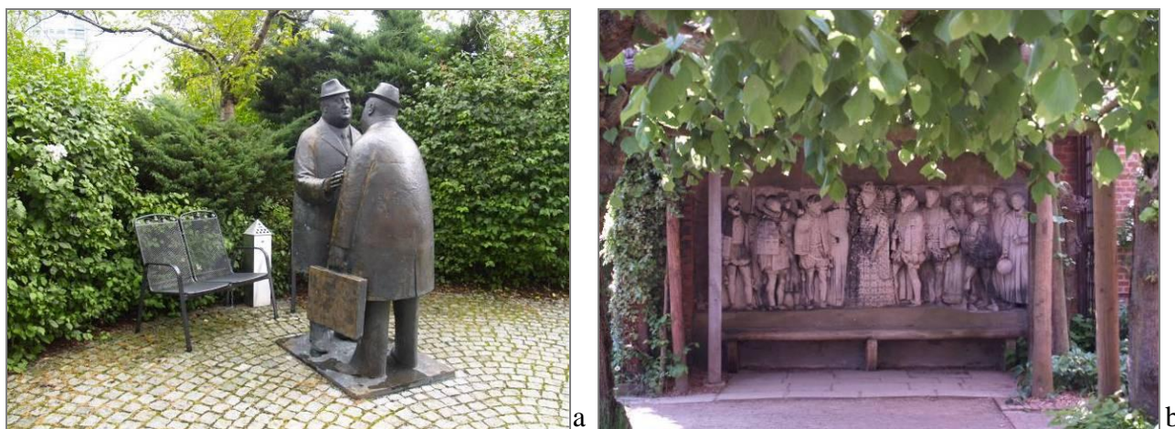
3 pav. Vientisa meninė visuma

Menų sąveikos problematika visada išliks aktuali, nes tik sintezėje praturtėja kiekviena meno šaka, susikuria laiko stiliaus bruožai, bendrieji estetiški meno kriterijai (Mačiulis, 2003).