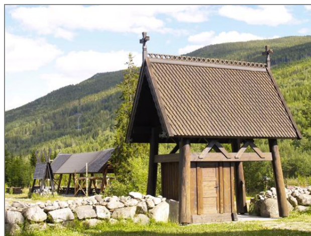
4 pav. Statiniai natūralioje gamtinėje aplinkoje Norvegijoje